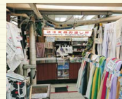
レジ前の様子(天井にパイプが通る)